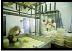
La cave coopérative des Entremonts

Départ 8h15 du Gîte 9h-11h Visite guidée de la Coopérative Laitière des Entremonts et dégustation Pique-nique au Cirque de St Même ou à St Même d'en Haut Rando Santé® au Cirque de St Même Retour au Gîte Verre de l'amitié Dîner Soirée libre