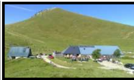
L'auberge du Charmant Som