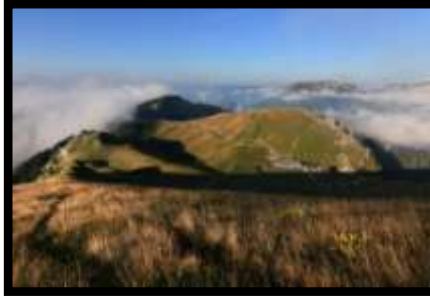
Le Charmant Som