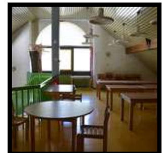
La salle dédiée

Comité départemental de la randonnée pédestre de l'Isère – Site : isere.ffrandonnee.fr