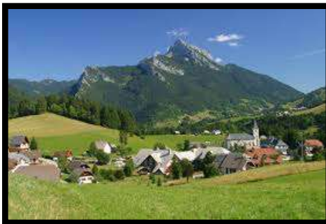
St Hugues en Chartreuse