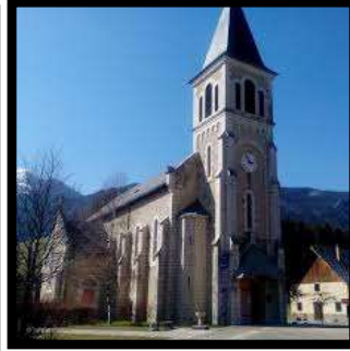
Musée d'Art Sacré Contemporain Arcabas