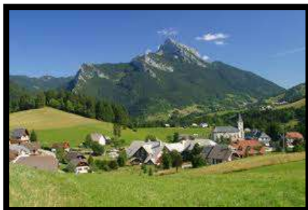
St Hugues en Chartreuse

St Hugues en Chartreuse est l'un des 53 hameaux de St Pierre de Chartreuse, Les Chalets St Hugues offrent une situation privilégiée dans le Parc Régional de Chartreuse où de nombreuses activités sont pratiquées. Il nous offrira de véritables opportunités pour exercer notre activité préférée : la Rando Santé® avec de beaux panoramas sur les sommets.