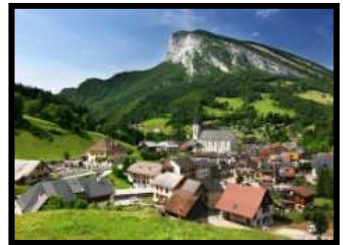
St Pierre de Chartreuse

Le village compte 53 hameaux dont le joli hameau de St Hugues en Chartreuse qui abrite le Musée d'Art Sacré Contemporain, Arcabas.