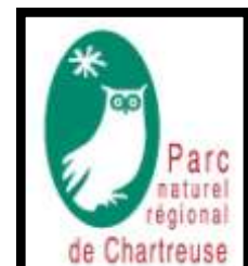
Intervention Sylvène Allard

Comité départemental de la randonnée pédestre de l'Isère – Site : isere.ffrandonnee.fr