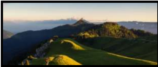
Le Charmant Som

Départ du Centre à 9h Rando Santé® Le Charmant Som, Passage par l'Auberge Pique-nique Visite Les Petits Jardiniers, Transformation des plantes aromatiques et médicinales à 14h15 Verre de l'amitié