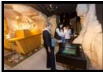
Le Musée de l'Ours des Cavernes