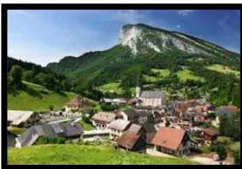
St Pierre d'Entremont