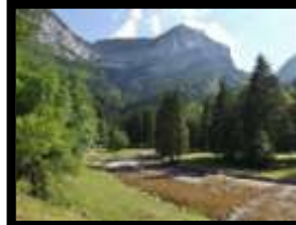
Le Cirque de St Même