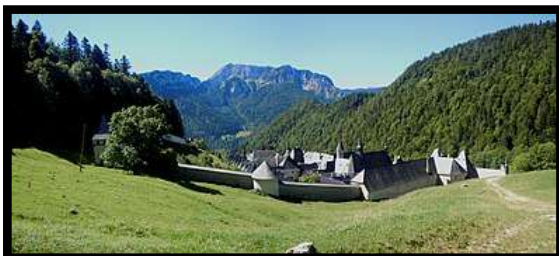
La Grande Chartreuse

Dîner Film documentaire, Chartreuse Verte Mystique et Mythique Enquêtes de Région, France 3 (30')