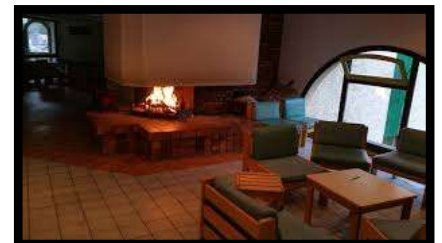
Un petit salon