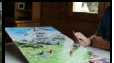
Le Pic des neiges Soirée jeux de société en lien avec la randonnée