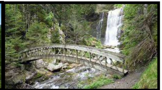
Le Cirque de St Mème