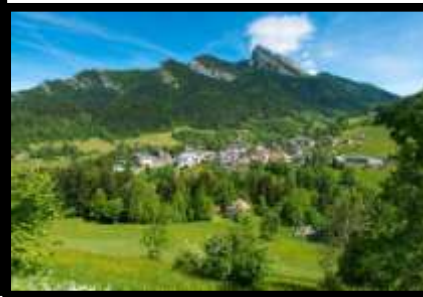
St Pierre de Chartreuse