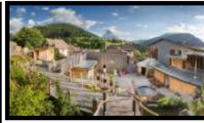
Espace Bien-Être Oréade