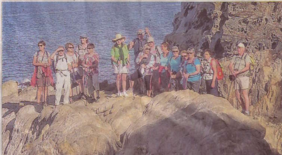
Sur le sentier du Littoral à La Londe-les-Maures.