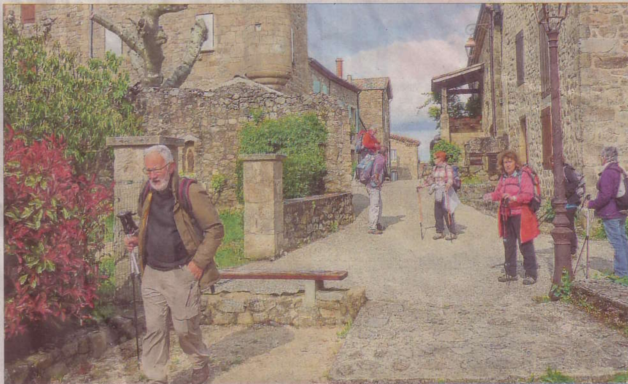
Chez les Marcheurs du pays roussillonnais, on associe sport et culture comme ici à Boucieu-le-Roi en Ardèche.

Si la marche nordique est en plein essor avec une cinquantaine de marcheurs inscrits à cette discipline, il manque des animateurs pour encadrer cette marche de deux heures qui se déroule les mercredis matin et samedis matin de 9 heures à 11 heures. Cette année, 160 randonnées ont été proposées aux adhérents de l'association qui compte 44 encadrants.